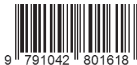
Illustration couverture